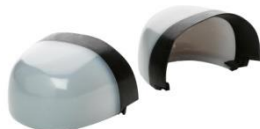
Puntera no metálica