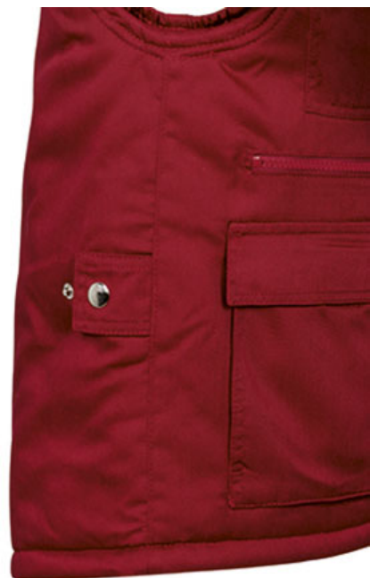
Vista lateral: espalda más larga