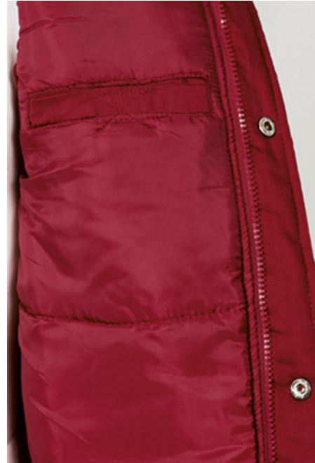
Vista lateral: espalda más larga