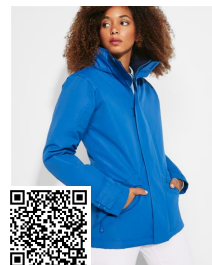
EUROPA WOMAN PK5078