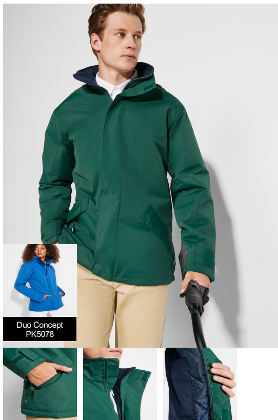
Duo Concept PK5078